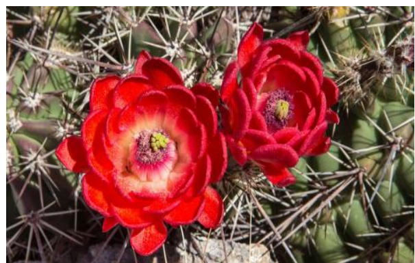
Ec. polyac. ssp. transpecosensis ., Polvorillas