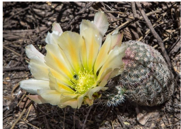
Ec. pectinatus , Agua Caliente